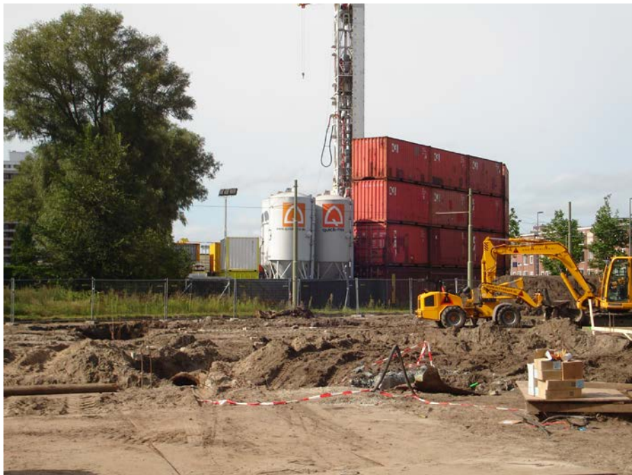
Centrale voor de Aardwarmte in aanbouw.

Gemeentelijk Contact Centrum : contactcentrum@dsb.denhaag.nl